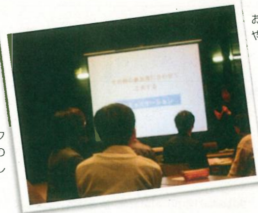
研修会の様子。 グループワークや実際に接客の練習をしたりして学習。→