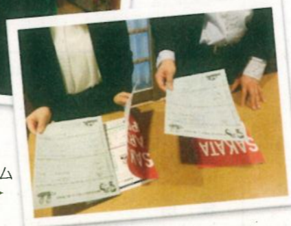
お客様へお渡しする公演プログラムやチラシの折り込み作業の様子。→