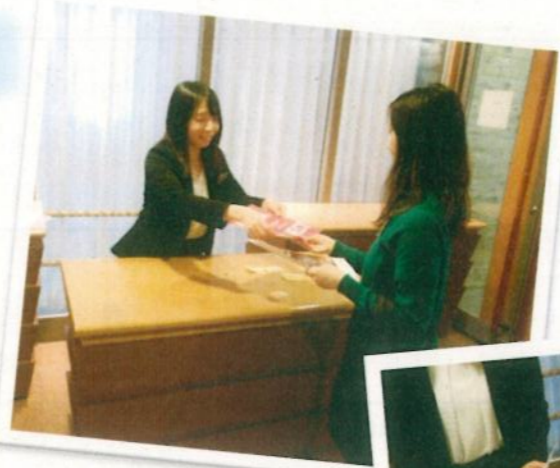
↑ チケット確認などの受付業務。

コンサートなどのイベントで、お客様をお迎えする準備や接客などの業務をお願いしています。サポーターさんの作業や笑顔のおもてなしは、事業を成功させるためにも大事なものです。